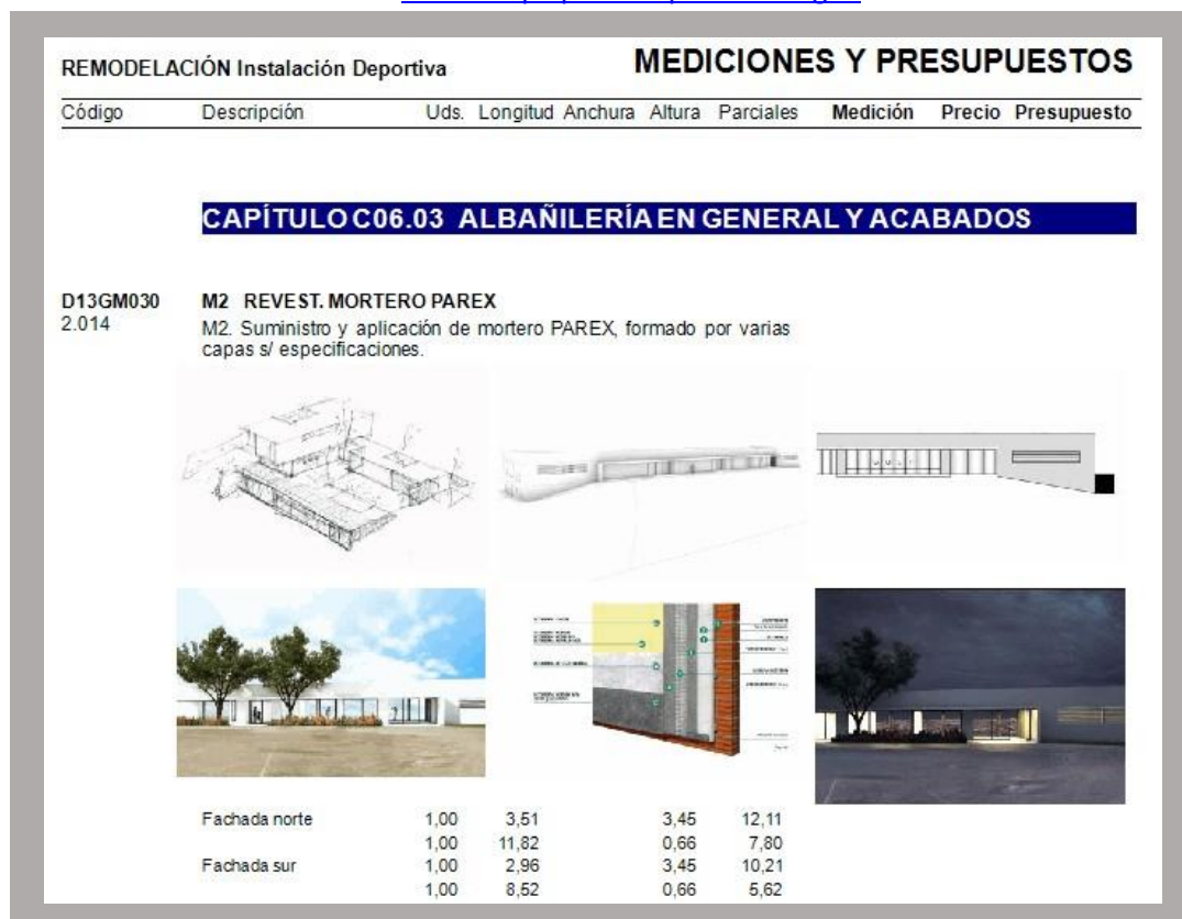
IMAGEN 1 (hojas del presupuesto)

Hoja del presupuesto del proyecto inicial al cual se le ha añadido a una partida imágenes aclaratorias y definitivas.