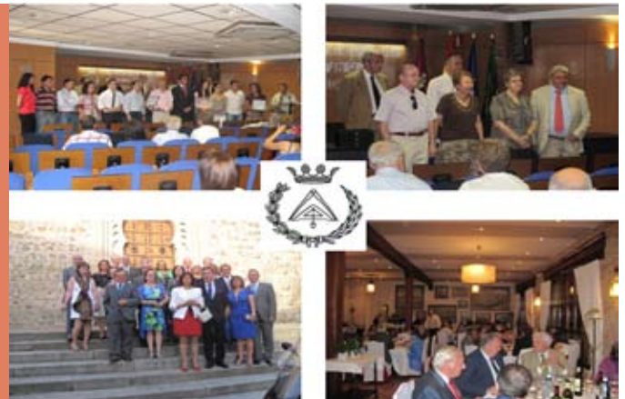
X SEMANA CULTURAL