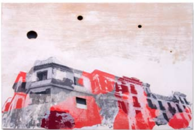
SALA DE EXPOSICIONES

Se ha impartido durante los días 17, 18, 21 y 23 de mayo de 2012, en la Sede del COATIE de Toledo, desde un punto de vista práctico, con ponencias de expertos y talleres. Se clausuró con la entrega de los diplomas acreditativos a los asistentes. [pág. 9]