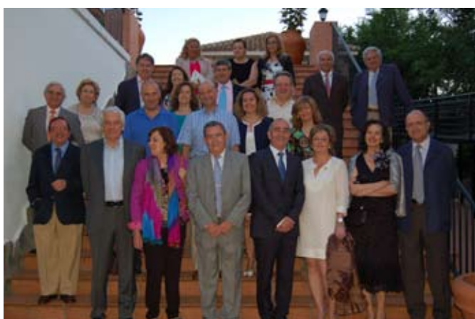
CENA DE HERMANDAD