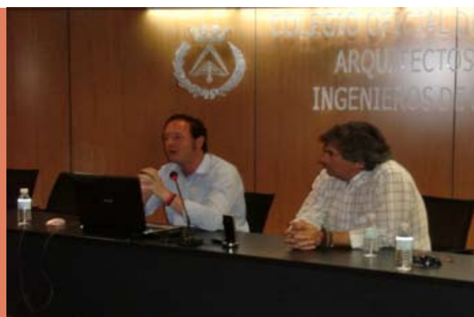
JORNADA TÉCNICA SIBER