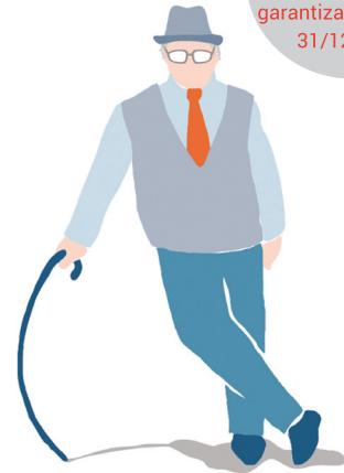
El Plan de Previsión Asegurado de Premaat fue lanzado en 2014 con la campaña "¿Conoces a Pepe A.?"

Interés técnico garantizado hasta el 31/12/2015