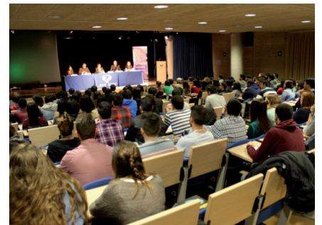
Un momento del Congreso de estudiantes que contó con el patrocinio de Premaat.

alumnos la necesidad de estar dado de alta en un sistema de previsión social para trabajar, ya sea en el Régimen General de la Seguridad Social si somos asalariados, o en el Régimen Especial de Trabajadores Autónomos de la Seguridad Social (RETA) o, alternativamente, Premaat si trabajamos por cuenta propia. Las cuotas de Premaat son, en líneas generales, un 20% más económicas que las cuotas del RETA. Nuestro Plan Profesional incluye las prestaciones de Jubilación, Fallecimiento, Incapacidad temporal, Incapacidad permanente, Maternidad/paternidad y Riesgo durante el embarazo.